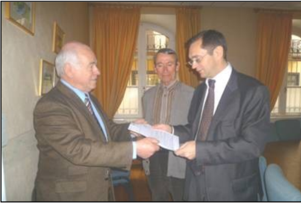
La remise du projet de motion au député Morel à l'Huissier, Président de la Communauté de Communes des Hautes Terres