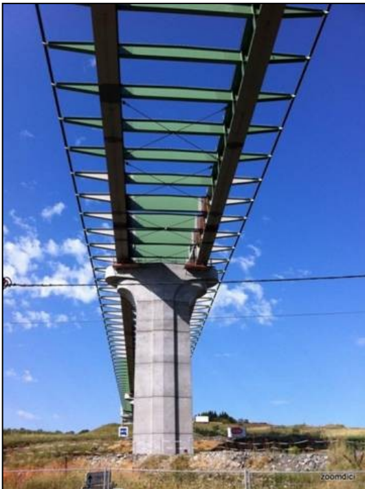
Viaduc de Taulhac, déviation du Puy -en-Velay (Haute-Loire)