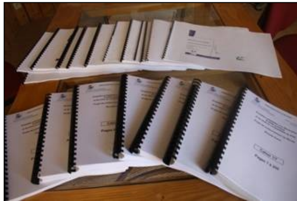
Les registres de l'enquête publique et devant, les 7 recueils de 1286 lettres adressées aux commissaires enquêteurs