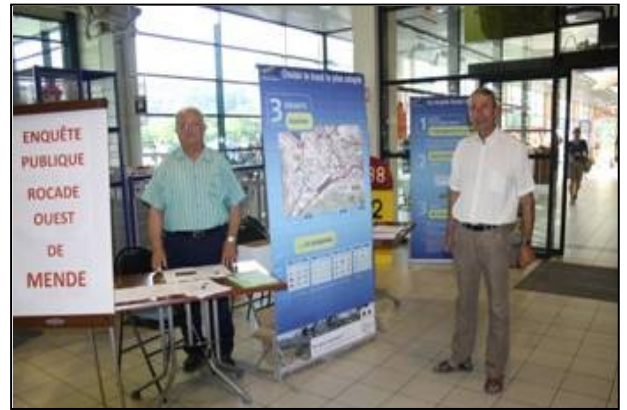
La fin des 2 journées de collecte de signatures à Mende le 2 juillet 2011