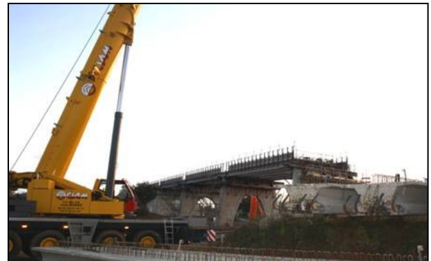
Environs de Croix de Mille (Tarn) - novembre 2011