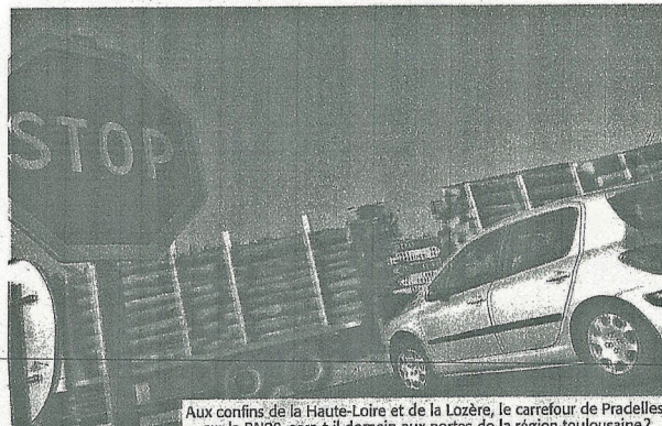
Aux confins de la Haute-Loire et de la Lozère, le carrefour de Pradelles, sur la RN88, sera-t-il demain aux portes de la région toulousaine?